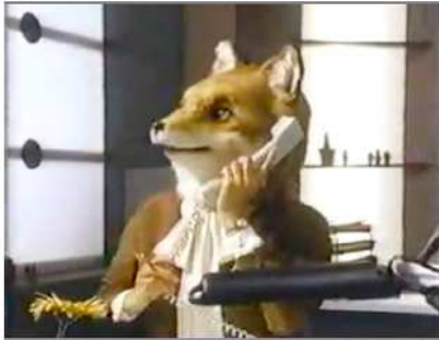
Publicité télévisée pour Interurbain Bell (1990)