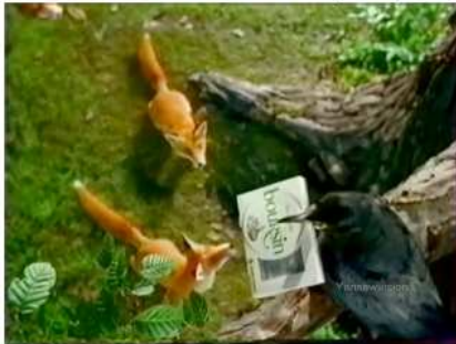
Publicité télévisée pour le fromage Boursin : Le corbeau et « les » renards (2000)

Dans la même série publicitaire : La grenouille et le boeuf , Le lièvre et la tortue et le corbeau et le renard . Cf. www.youtube.com