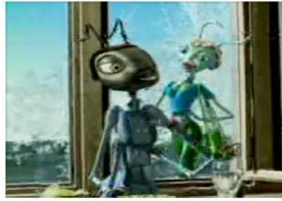
Publicité télévisée pour l'eau minérale Badoit : La cigale et la fourmi (2000)